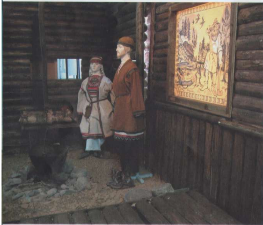
Реконструкция «Средневековое жилище».

В 1997 году в музее-заповеднике «Иднакар» была начата большая работа по созданию экспозиции «Городище Иднакар IX–XIII века» 1 . Исполнителями выступили коллектив художников под руководством Владимира Николаевича Дерягина. Основной задачей экспозиции была всесторонняя реконструкция жизни городища Иднакар. В качестве основы были приняты материалы многолетних археологических исследований. Структура экспозиции подчиняется строгой логике: земледелие и скотоводство, охота и рыболовство, косторезное искусство, домостроительство и деревообработка, ткачество и изготовление одежды, ювелирное искусство, черная металлургия и кузнечное мастерство, средневековое оружие, оборонительные сооружения и военное дело, средневековая