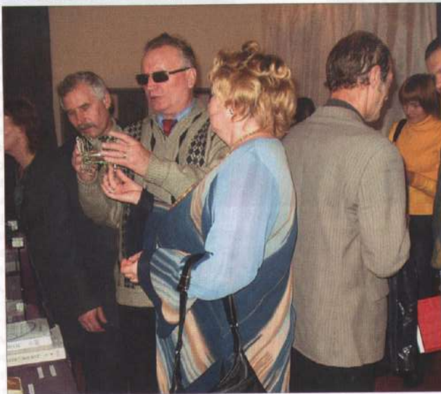
Презентация выставки «Фактура времени».

кончиками пальцев ощупывали тактильные экспонаты, читали подписи и комментарии, живо интересовались назначением отдельных предметов и историей нашего края. Восхищение